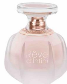
レーヴ・ダンフィニ 30ml 9,900円(税込)