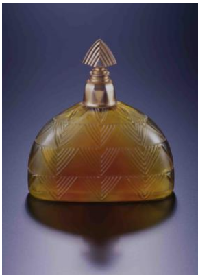
▲香水瓶《ヴェール・ル・ジュール》ウォルト社 1926年