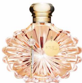
ソレイユ 30ml 9,900円(税込) 100ml 20,900円(税込)