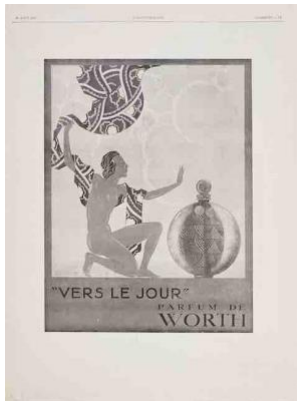
▲広告《ヴェール・ル・ジュール》ウォルト社 1929年