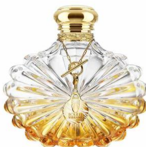
ソレイユ・ヴィブラント 50ml 14,300円(税込) 100ml 20,900円(税込)