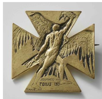
▲ブローチ《兵隊さんの日》1915年