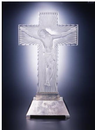
▲ランプ《キリスト》1930年