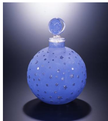
▲(写真左)ベッドサイドランプ「日本の林檎の木」(1920年) (写真右)香水瓶「ダン・ラ・ニューイ」ウォルト社(1924年)