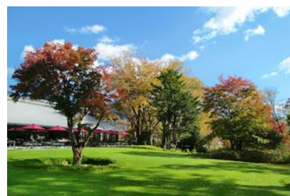
▲箱根ラリック美術館併設のカフェ・レストラン「LYS」