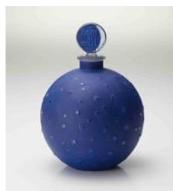
▲香水瓶「ダン・ラ・ニュー」 1924年(ウォルト社)

ルネ・ラリック(1860-1945)といえば、真っ先に「香水瓶」を思い浮かべる方も多いのではないのでしょうか。1900年のパリ万博でグランプリを獲得し、独創的なジュエリー作家として不動の地位を築いたラリックが、香水瓶のデザインと製造という新たな創作のジャンルを開拓したのは、香水商フランソワ・コティとの出会いがきっかけでした。ラリックは目には見えない香りの魅力やイメージを、花々や真夜中に輝く月といった自然の優美さや都会にそびえる高層ビルのスタイリッシュさに例え、瓶の造形やデザインで表現しました。容器という枠を超え、美しく繊細な意匠に物語(ドラマ)がこめられたラリックの香水瓶は、またたく間に人びとの心を掴みました。時には大切な人への愛を、そして時には戦場からの帰還への願いを、さまざまな想いを代弁する贈り物として、長く愛されてきたのです。モダンでスタイリッシュなデザインに、たくさんの想いを秘めたドラマチックなラリックの香水瓶の世界をご堪能ください。