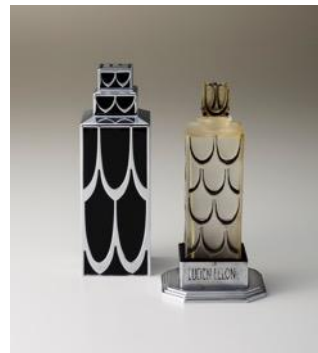
▲「香水 A(または香水 N)」1929年 (リュシアン・ルロン社)