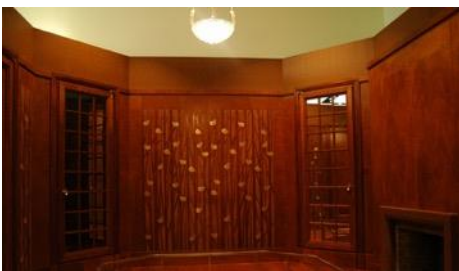
(左) モチーフとなった室内装飾「雀」1929年