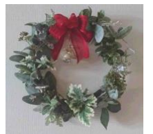
※若松氏ワークショップイメージ画像

リースを製作した後は、オリエント急行としても活躍した車両と一緒に記念撮影もできます。