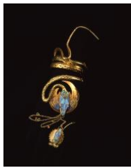
左/「カーネーション:四つの花」1897年 右/「モナコ・モンテ・カルロ」1897年 右下/特別展示「蛇のブレスレットと指輪」1899年 堺 アルフォンス・ミュシャ館(大阪府堺市) 蔵