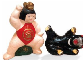
酒田土人形(山形県)「熊投げ金太郎」鹿野コレクション