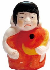
弓野土人形(佐賀県)「鯉抱き」鹿野コレクション