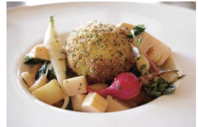
オードブル「皿の上の春」