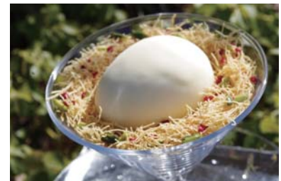
スイーツ「ニ・ド・フロマージュ」