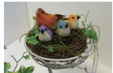
組み合わせて作る鳥の巣

雑貨のセレクトショップ「PASSAGE (パッセージ)」では、特別企画展の関連グッズを販売します。おすすめは、小鳥のパーツと巣を組み合わせる、オリジナルのインテリア小物。まず、大小2～3種類の中から好きな鳥の巣を選びます。そこに、好みの小鳥をのせて、足のワイヤーで固定するだけ。自由にアレンジできるのが魅力です。さらに鳥柄アイテムのコーナーでは、クリアファイル、クリップ、ブックカバーなどのステーショナリーを用意。旅の思い出に最適です。