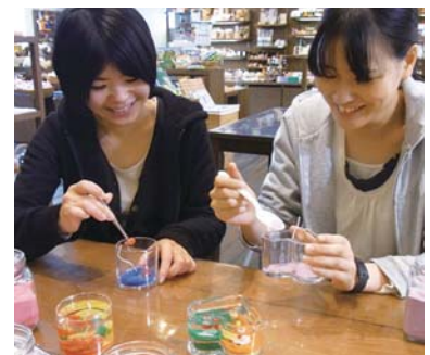
ジェルキャンドル体験