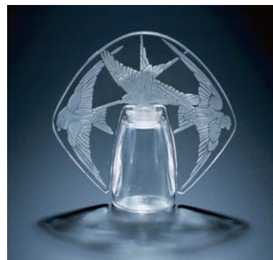
ルネ・ラリック作 香水瓶「三羽のツバメ」1920年

期 間 2012年4月28日(土)～9月30日(日) 会 場 箱根ラリック美術館 (常設展示室・企画展示室) 出展作品 ルネ・ラリック作